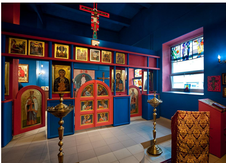
Kaplica św. Męczennika Grzegorza Peradze w Warszawie