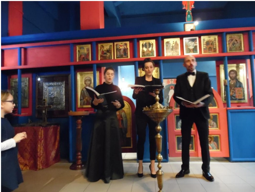
Chór żydowski na uroczystości w kaplicy prawosławnej

wosławnej im. św. Męczennika Archimandryty Grzegorza Peradze w Warszawie. Kaplica ta powstała z jego inicjatywy, jako jedyne miejsce w Polsce, gdzie liturgia prawosławna odbywa się po polsku, podczas gdy w pozostałych cerkwiach w Polsce językiem Kościoła Prawosławnego jest język starocerkiewnosłowiański.